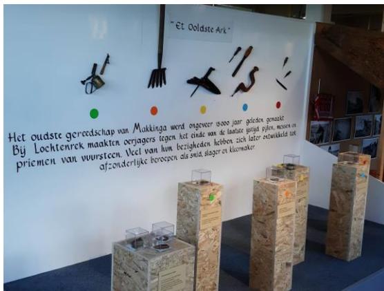
"Et Ooldste Ark"

De expositie heeft de toepasselijke naam "Et Ooldste Ark" en toont artefacten die zijn gevonden bij Lochtenrek.